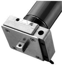
· SOS Tronic