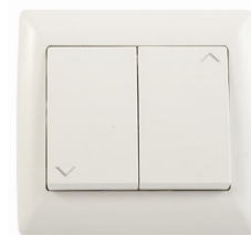
· Pulsador dos teclas