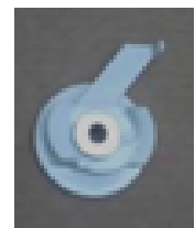
Soporte techo redondo